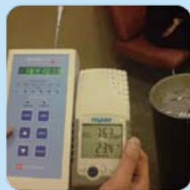
在吸煙區的懸浮粒子數量：每公升空氣超過1,600,000粒，超出世衛指引27倍。*