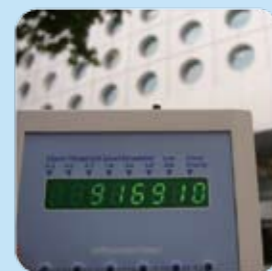
中環的懸浮粒子數量：每公升空氣超過900,000粒，超出世衛指引15倍。*