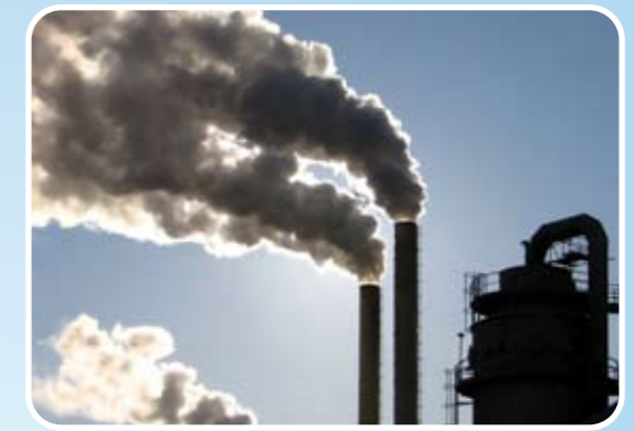
珠三角的工廠及發電廠