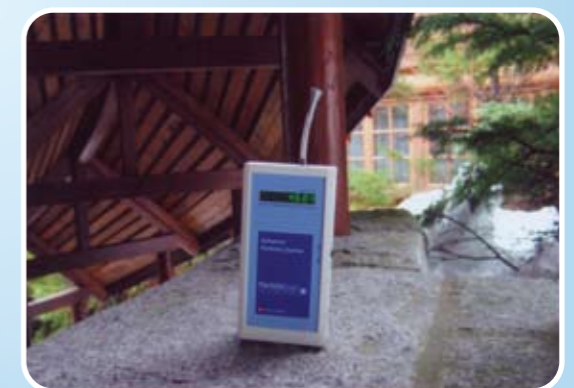
測試加拿大戶外的懸浮粒子數量 (每公升空氣有 4,604 粒懸浮粒子)