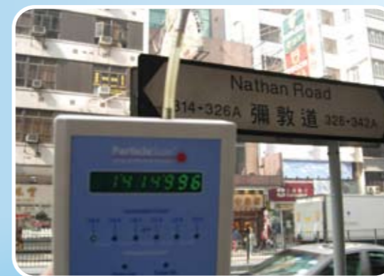
測試旺角彌敦道的懸浮粒子數量 (每公升空氣有 1,414,996 粒懸浮粒子，超出世衛指引 24 倍**)