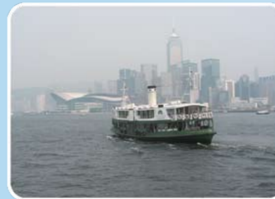
香港的空氣污染問題